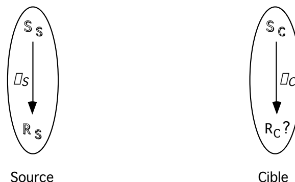
Figure 1 : Schéma général pour l'analogie. Un cas source, connu comme une paire (S_S, R_S) (Situation, Résultat) Source , est utilisé en tant que modèle ou indication pour la complétion d'un cas cible dans lequel la partie R_C (Résultat) Cible est manquante. La relation de dépendance \square_S entre R_S et S_S n'est souvent pas connue explicitement. Le raisonnement analogique impliquant d'ailleurs l'interprétation, donc le travail de redescription des parties S_S , R_S et S_C , ainsi que la découverte d'une relation de dépendance \square_C "analogue" à \square_S .

Dans la modélisation standard, le raisonnement analogique implique la rencontre de deux "objets" : l'un que l'on appelle la source , et l'autre, la cible , que l'on suppose incomplet, et dont on désire parfaire la description à l'aide de la source. Ainsi, par exemple, la description partielle des courants électriques dans un circuit pourrait être complétée à l'aide d'un rapprochement avec un circuit hydraulique comparable et plus complètement décrit. On identifie donc dans la cible la partie existante (notée S_C pour Situation Cible) et une partie manquante (notée R_C pour Résultat Cible). La plupart des travaux, et le nôtre à leur suite, font généralement l'hypothèse _qui n'est pas mince_ qu'il est possible d'isoler de même une situation source S_S , correspondant à la situation cible S_C , et le résultat source R_S qui a pour pendant hypothétique R_C . Finalement, c'est seulement si il existe une relation de dépendance (notée \square_S ) entre S_S et R_S , que l'on peut espérer calculer R_C à partir de S_C , par la découverte d'une relation de dépendance analogue \square_C . On obtient alors le schéma de la figure 1.